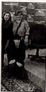
hiurcanas con Surtano